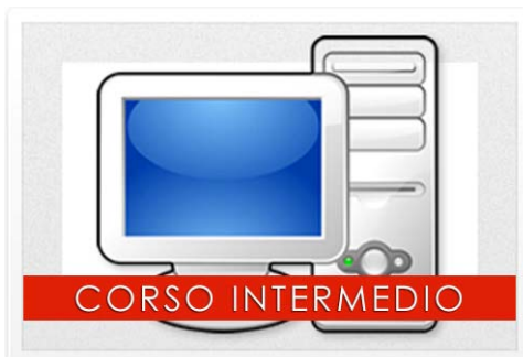
CORSO DI INFORMATICA INTERMEDIO (di 2do livello) (Vedi scheda allegata)