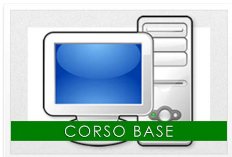
CORSO DI INFORMATICA DI BASE (Vedi scheda allegata)

Nel mese di febbraio 2014 partiranno nei paesi di Padena, Canneto sull'Oglio, Torre de' Picenardi e S. Giovanni in Croce i seguenti corsi.